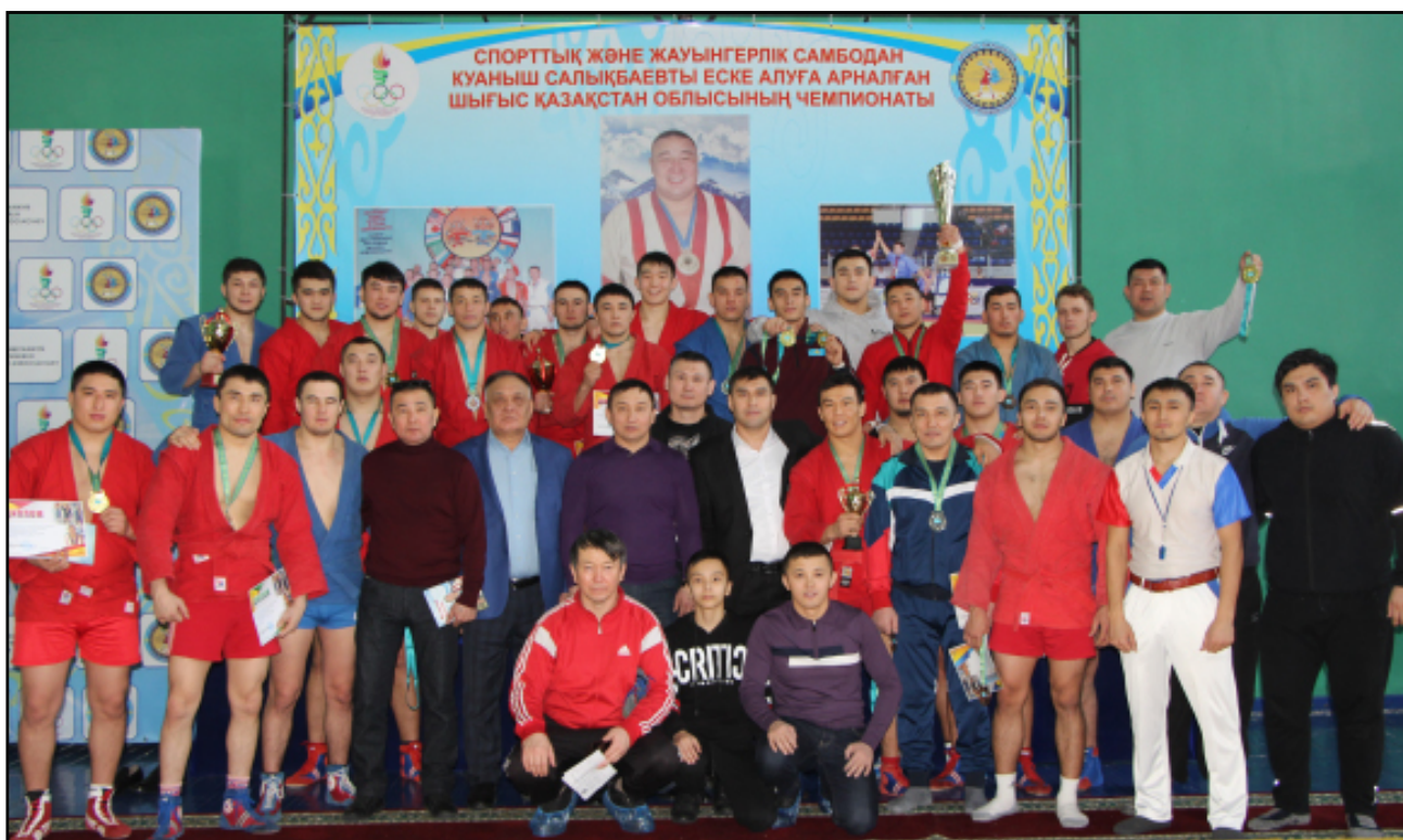
Жарыстан соң. 12 ақпан. Семей.