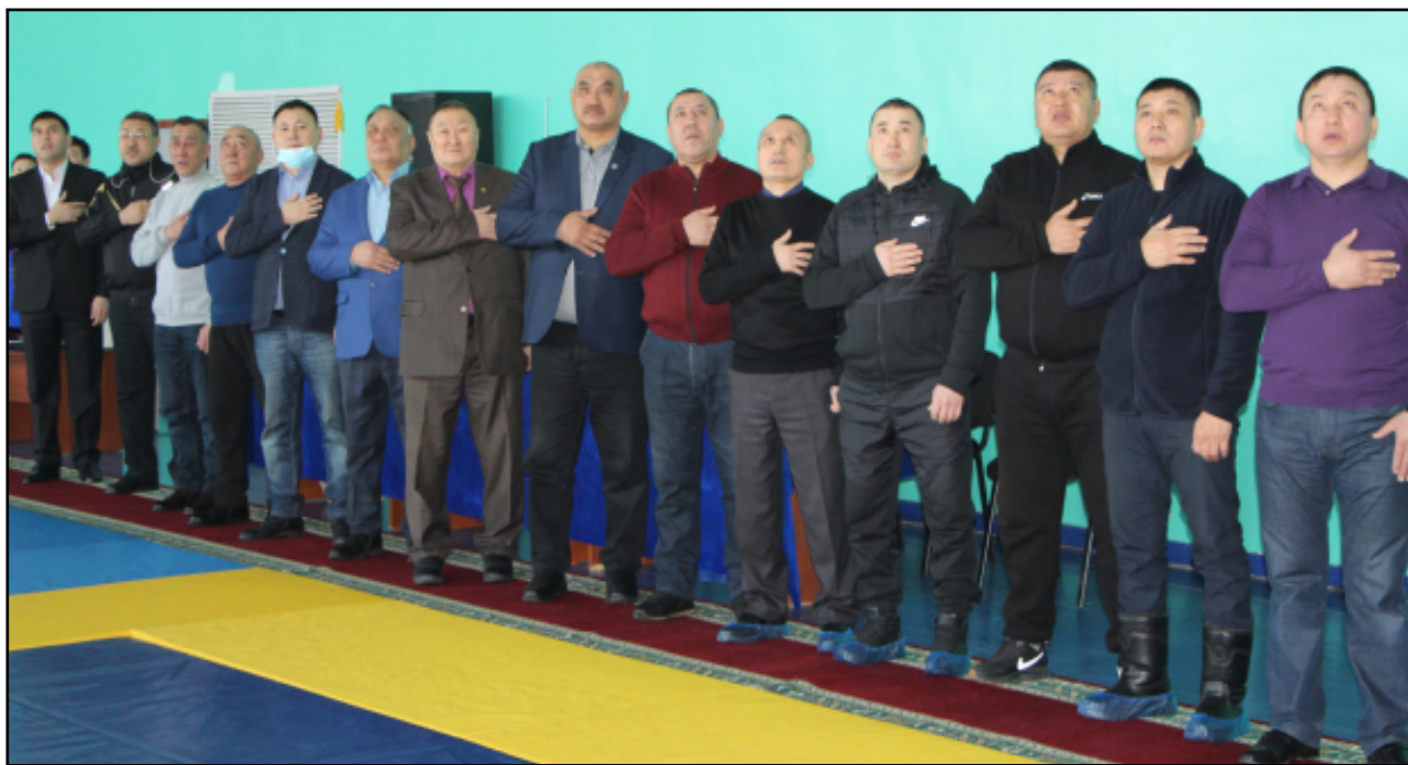
Чемпионаттың салтанатты ашылуына қатысқан ардагер балуандар мен бапкерлер және жарысты ұйымдастырушылар.

Жарыстың алғашқы күні Семей балуандары мен бапкерлері Қуаныштың аруағына арнап ас беріп, құран оқытты. Оған чемпионаттың қонақтары, балуанның туған-туыстары, отбасы қатысып, бата-тілек жасасты. Дастарқан басында сөз алған Семей